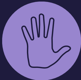
Piel más Pálida